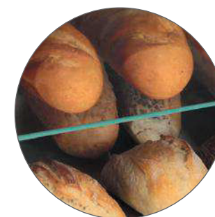
Maxi 30 pieces